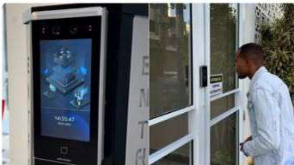
Sistema de reconhecimento facial no Tatuapé, Zona Leste de SP.